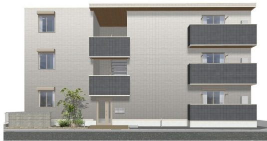
※ 完成予想図につき多少異なる場合があります