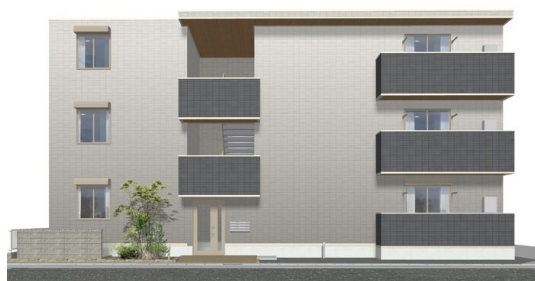
※ 完成予想図につき多少異なる場合があります