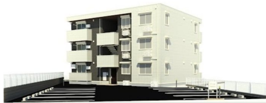
※完成予想図につき多少異なる場合があります。