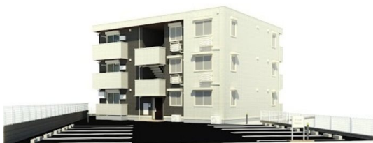
※完成予想図につき多少異なる場合があります。